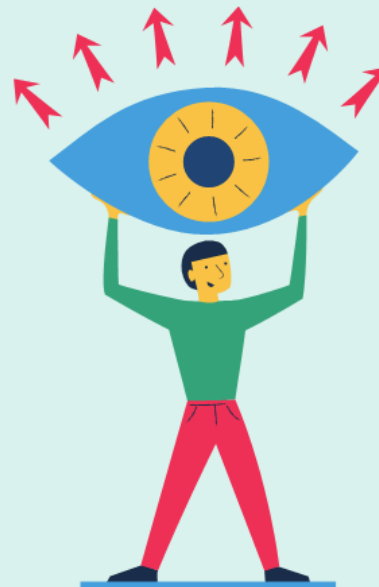
Etappe 2: Utsyn