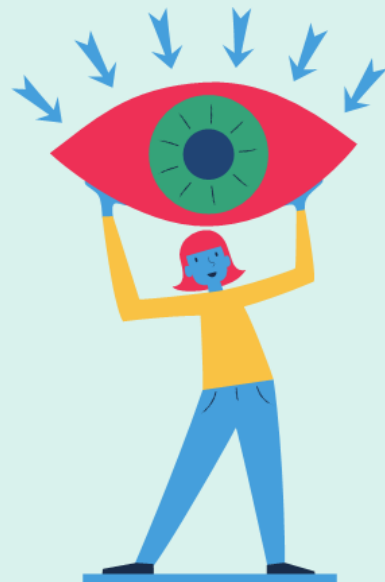
Etappe 1: Innsyn

et lederutviklingsprogram for statsforvalterne