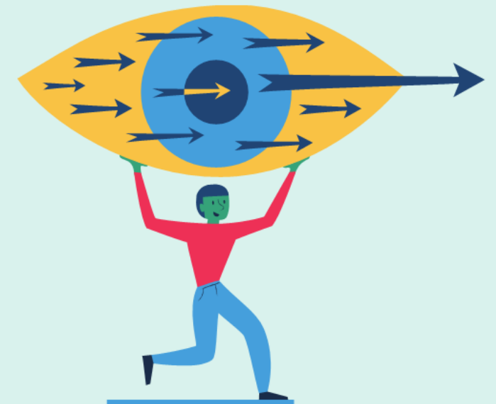
Etappe 3: Framsyn